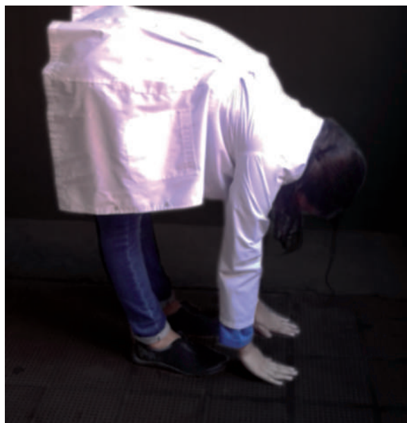
Figura 5 Criterio 5 Flexión de la columna.

El criterio 5 en que el paciente de pie apoya las palmas de las manos en el suelo con las piernas extendidas, fue el más frecuente identificado en la exploración tal como se observa en el gráfico 2.