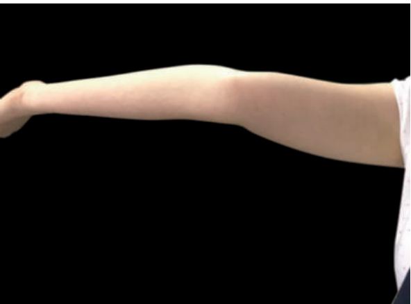
Figura 3 Criterio 3 Hiperextensión de codo.