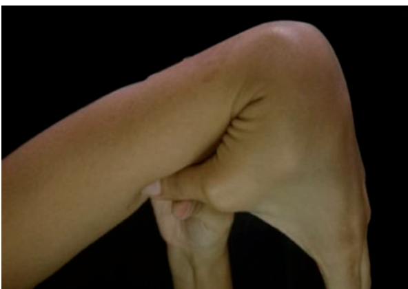
Figura 2 Criterio 2 Aposición del pulgar sobre el antebrazo.