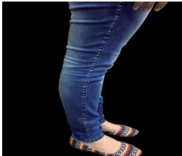
Figura 4 Criterio 4 Hiperextensión de las rodillas.