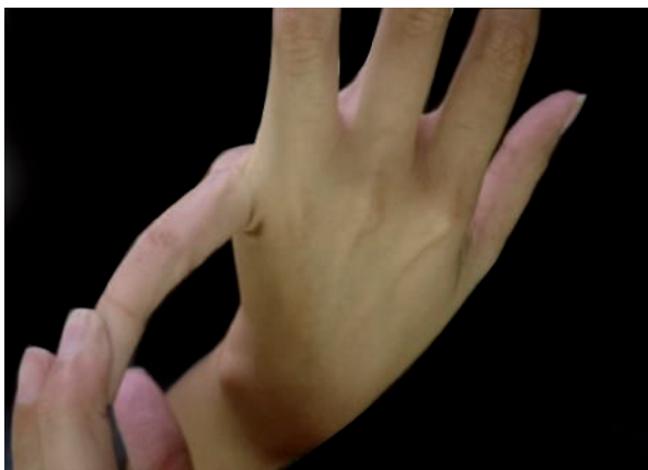
Figura 1 Criterio 1 Hiperextensión del dedo meñique.