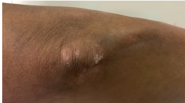
Figura 2 Lesiones de psoriasis en codo.

ta por primera vez en marzo de 2016; con antecedente de diagnóstico de psoriasis cutánea a los 30 años, sin antecedentes familiares y de haber sido tratada con anterioridad. Además refiere ser tabaquista y peluquera. La paciente acude por dolores articulares y edema de rostro, manos y pies de 7 meses de evolución, acompañado de rigidez articular matutina.